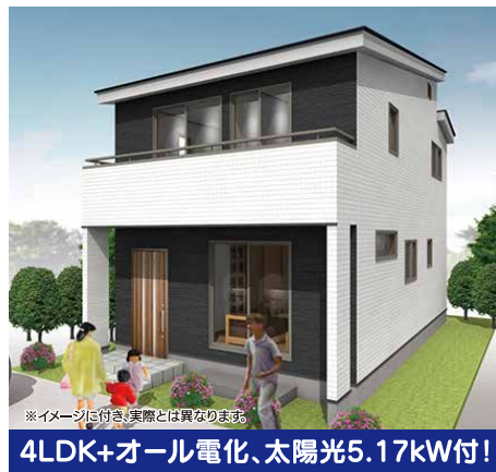
4LDK+オール電化、太陽光5.17kW付!

●郡山市静町328の一部 ●オール電化、IH、エコキュート ●システムキッチン(食洗器付) ●シャワーブレードレスサー ●シャワートイレ(2ヶ所) ●ユニットバス(暖房乾燥換気扇付) ●ペアガラス、網戸付 ●全室照明器具付 ●地デジアンテナ付 ●TVドアホン ●外構工事込 ●駐車場4台可 ●大成小・郡山第七中学校区 ●4LDK(洋7.1・洋6.2・洋6.1・洋3.7・LDK15.5) ●仲介