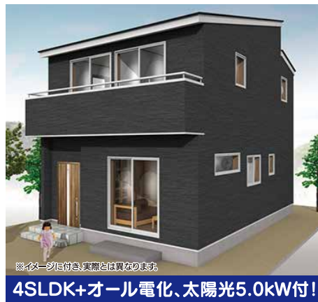
4SLDK+オール電化、太陽光5.0kW付!

●郡山市郡山市静町16-19の一部 ●オール電化、IH、エコキュート ●システムキッチン(食洗器付) ●シャワーブレードレスサー ●フチなしシャワートイレ ●システムバス(暖房乾燥換気扇付) ●ペアガラス、網戸付 ●照明器具付 ●TVアンテナ ●全室TVコンセント、ACコンセント付 ●外構工事込 ●駐車場3台可 ●大成小・郡山第七中学校区 ●4SLDK(洋5・洋6.2・洋7.5・洋3・LDK15.8・小屋裏収納5.5帖) ●仲介