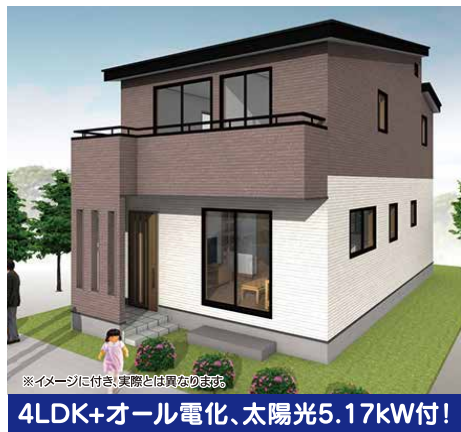
4LDK+オール電化、太陽光5.17kW付!

●郡山市静町328-2(No.2) ●オール電化、IH、エコキュート ●システムキッチン(食洗器付) ●シャワーブレードレスサー ●シャワートイレ(2ヶ所) ●ユニットバス(暖房乾燥換気扇付) ●ペアガラス、網戸付 ●全室照明器具付 ●地デジアンテナ付 ●TVドアホン ●外構工事込 ●駐車場4台可 ●大成小・郡山第七中学校区 ●4SLDK(洋6.7・洋6.2・洋5.0・洋3.0・LDK15.2・小屋裏収納6帖) ●仲介