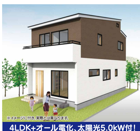
4LDK+オール電化、太陽光5.0kW付!

●郡山市静町328-4(No.4) ●オール電化、IH、エコキュート ●システムキッチン(食洗器付) ●シャワーブレードレスサー ●シャワートイレ(2ヶ所) ●ユニットバス(暖房乾燥換気扇付) ●ペアガラス、網戸付 ●全室照明器具付 ●地デジアンテナ付 ●TVドアホン ●外構工事込 ●駐車場3台可 ●大成小・郡山第七中学校区 ●4SLDK(洋6×2・洋5.5・洋3.0・LDK15.1・小屋裏収納4.5帖) ●仲介