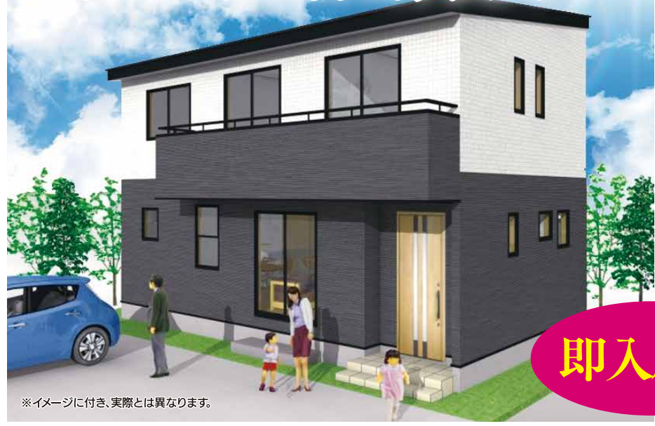
※イメージに付き、実際とは異なります。